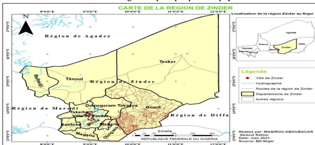
Carte : Localisation de la région de Zinder

La région de Zinder est située au Centre-Est du Niger (voir la carte ci-dessous). Elle est limitée à l'Est par la région de Diffa, à l'Ouest par la région de Maradi, au Nord par celle d'Agadez et au Sud par la République fédérale du Nigeria. Elle compte 10 départements et couvre une superficie de 155 778 km 2 , soit 12,3% du territoire national avec une population estimée à 3.500.000 habitants en 2021, soit la région la plus peuplée du pays.